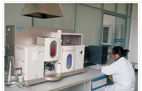
化学分析室 Chemical Analytic Laboratory