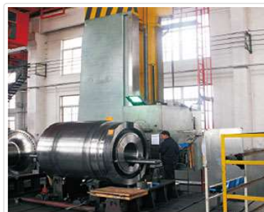
220镗铣床 220 Boring Milling Machine