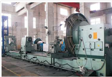
12M卧车 12M Horizontal Lathe