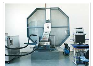
低温冲击试验机 Impact Testing Machine