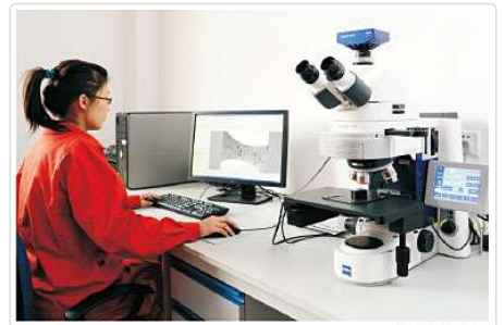
物理检验室 Physical Testing Laboratory