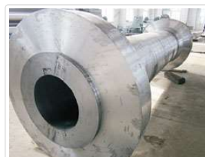
双法兰水轮机主轴 Hydraulic Turbine Shaft