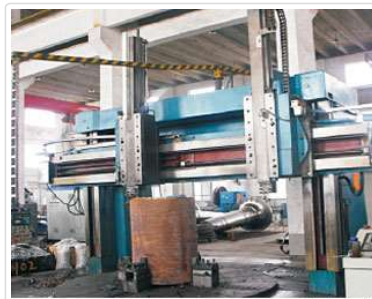
4M立式车床 4M Vertical Lathe