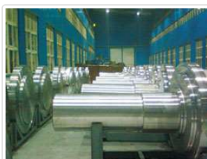
华锐风电主轴34CrNiMo6 Sinovel 1.5MW