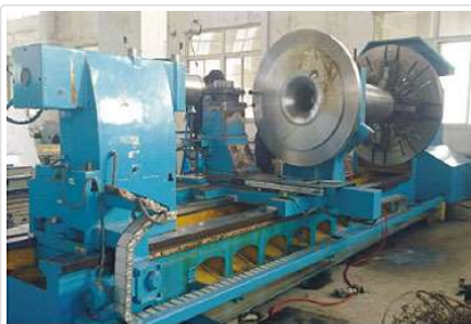
5M数控卧车 5M CNC Horizontal Lathe