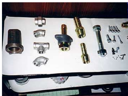
ロストワックス部品