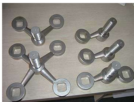
ロストワックス部品