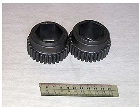
ロストワックス部品