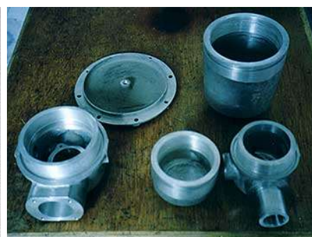
ロストワックス部品