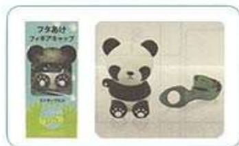
フタあげフィギアキャップ (ストラップ付き)