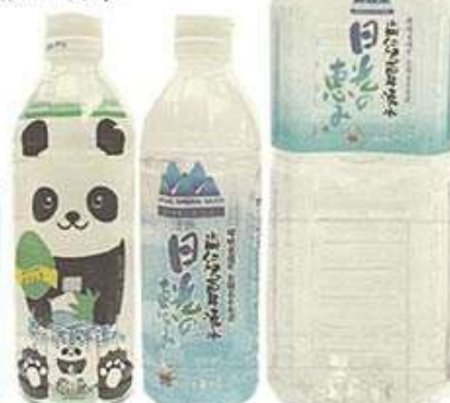
復興支援 パンダボトル 500ml